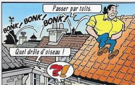
- Via daken lopen. - Wat een rare vogel!