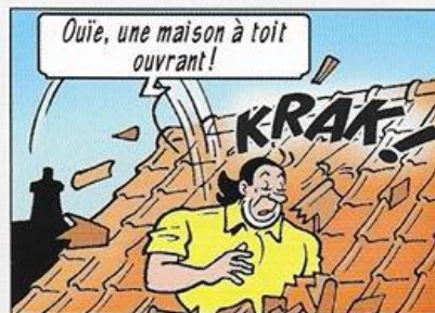
Oei, een huis met open dak!