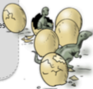
Des œufs de dinosaures